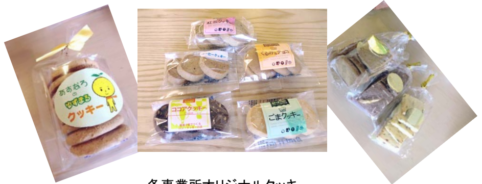
各事業所オリジナルクッキー 100円～300円