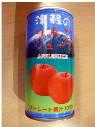
青森産りんご ストレート果汁 りんごジュース 1本150円