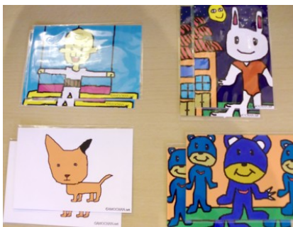
とってもキュートなイラスト ポストカード 100円