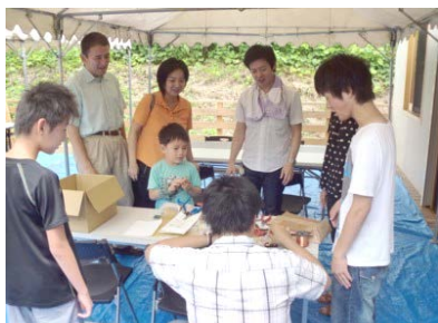
「夏休み真っ最中の小学生 よっといでん」 豊田高専の学生たちによるモーター作り 夏休みの宿題として頑張っていました。

心配された天気も問題なく、来客数約100名、スタッフ・関係者も含めると約150名のイベントになりました。