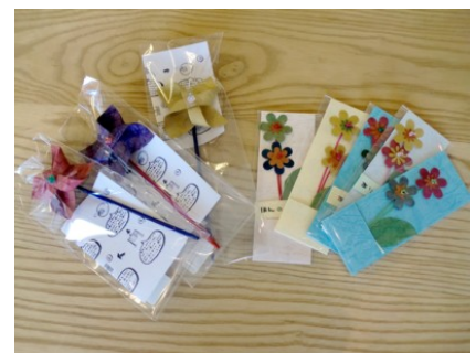
米袋を加工した素敵な小物 クラフトパーツ かざぐるま 各種100円

その他、焼きドーナツ、さをりストラップなど様々な商品を取り揃えています。また交流館祭や各イベントでの出店の際には、その日限りの限定商品も仕入れながら販売していきます。9月下旬から様々な場所で販売していきますのでよろしくお願いいたします。