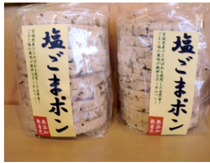
東北の米「ひとめぼれ」使用 塩ごまポン・えびぽん 各400円