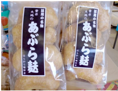
仙台のご当地グルメ あぶら麩 400円