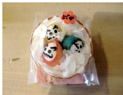
まゆだまで作ったかわいいだるま 復興だるま 1個600円