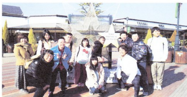
お給料で、カラオケや買い物などにも行きます。