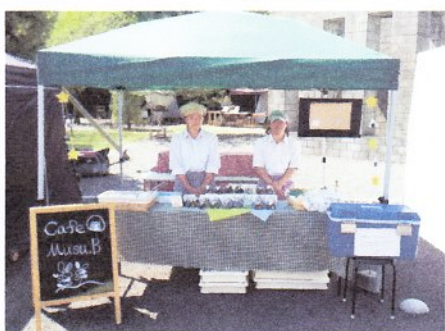
イベント出店も行っています。