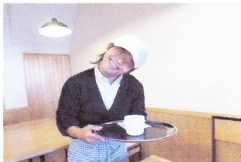
Cafe Musu. B 笑顔で接客します

知的障がいのあるご利用者様が通う「はたらくば」。今年で9周年を迎えました。喫茶事業、ランチボックスなどの販売でのイベント出店、農家さんからの仕事、箱折りや、パンフレット折り、ラベル貼り等の軽作業を取り組んでいます。また働いた給料を使っての外出活動も行っています。