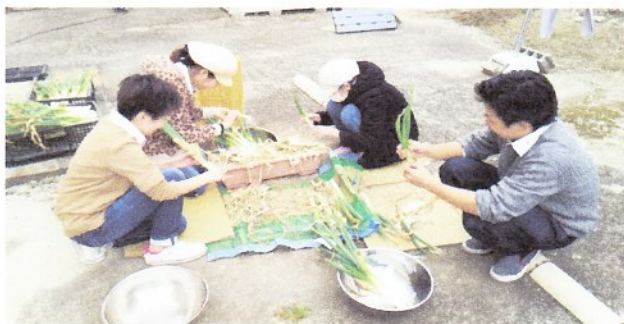
農家からネギの皮むきの仕事をいただいています。