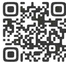
Cafe Musu.B Instagram